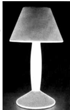
Martí Guixé, Lámpara Flamp , 1997.