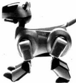
Perro robot Aibo , Sony Corp., 1999.